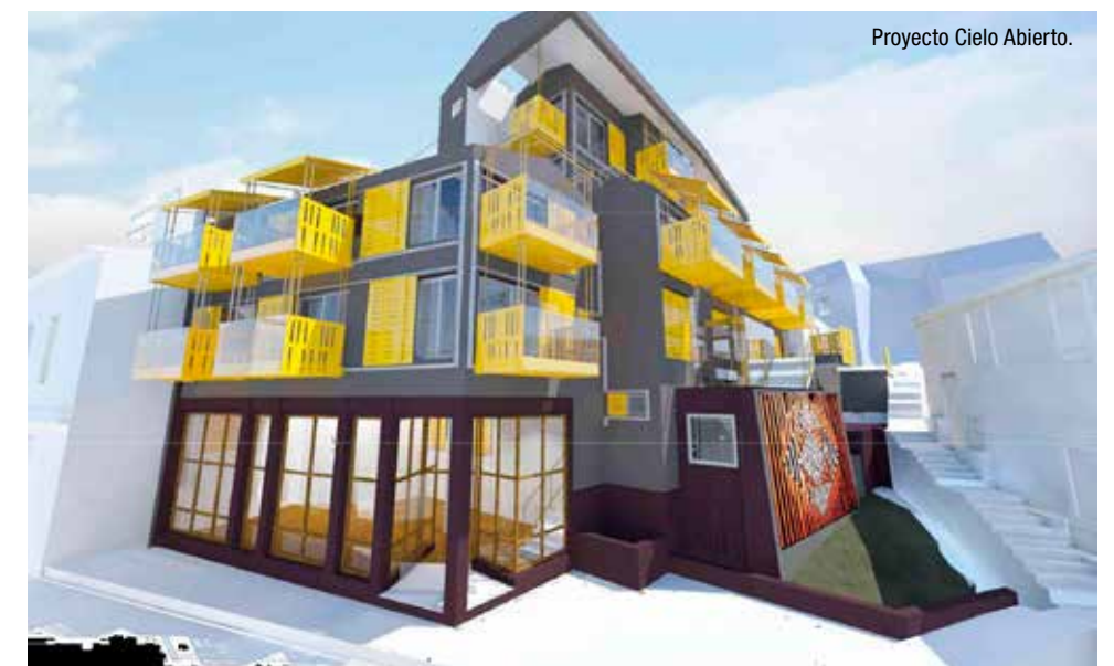
Proyecto Cielo Abierto.

www.consfaundez.cl 993308671 - 950079017 info@consfaundez.cl